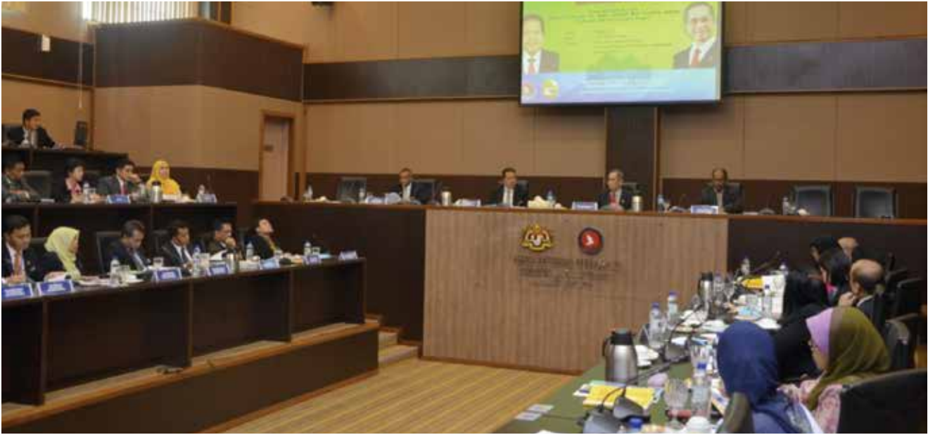
Laporan oleh: Unit Media & Komunikasi Korporat, Ibu Pejabat AADK