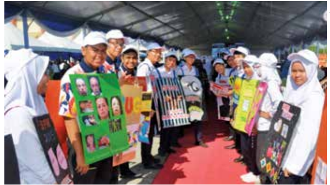
Laporan oleh: Unit Media & Komunikasi Korporat, Ibu Pejabat AADK