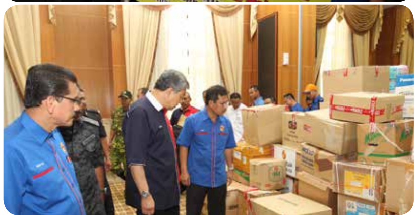
Pasir Salak, UiTM Sg. Galah dan SK Lambo Kiri, Parit di samping meninjau Pejabat-pejabat KDN yang terkesan banjir di Kg Gajah, Perak.

Kesimpulannya, hikmah banjir besar yang luar biasa di penghujung tahun 2014 walau pun memeranjatkan banyak pihak didapati telah menyatupadukan masyarakat Malaysia yang prihatin. Sumbangan dalam pelbagai bentuk meliputi tenaga, barangan dan wang ringgit telah secara spontan dihulurkan bagi membantu mereka yang terjejas.