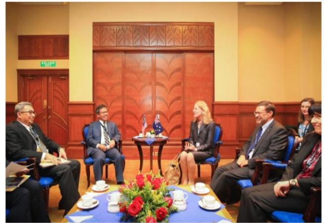
26 September 2018 | Mesyuarat Dua Hala Malaysia & Australia di SOMTC ke-18