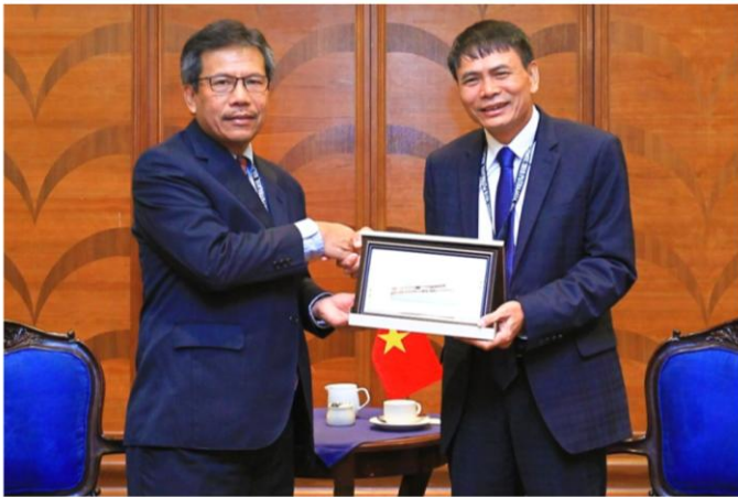
24 September 2018 | Mesyuarat Dua Hala Malaysia & Vietnam di SOMTC ke-18