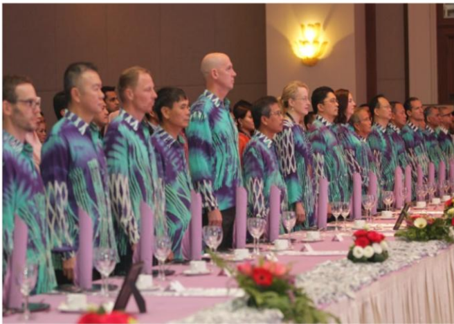
27 September 2018 | Majlis Makan Malam Sempena Mesyuarat Peringkat Pegawai-Pegawai Kanan Asean Mengenai Jenayah Rentas Sempadan (SOMTC) Ke-18