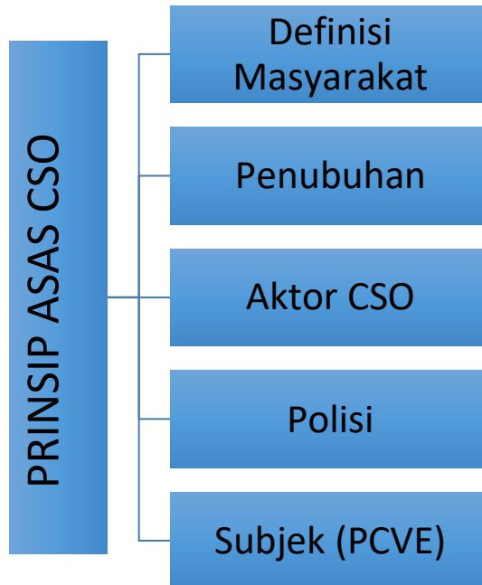
Rajah 1: Lima prinsip asas dalam membangunkan Civil Society Organisation (CSO) yang efektif dan lestari.