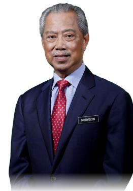
YB TAN SRI DATO' HJ. MUHYIDDIN BIN HJ. MOHD. YASSIN MENTERI DALAM NEGERI

“DALAM ERA GLOBALISASI YANG SEMAKIN MENCABAR DAN PERKEMBANGAN TEKNOLOGI BAHARU BERASASKAN REVOLUSI INDUSTRI 4.0, RISIKO DAN ANCAMAN TERHADAP KESELAMATAN NEGARA KINI MENJADI SEMAKIN KOMPLEKS DAN MERENTASI SEMPADAN.”