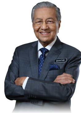
YAB TUN DR. MAHATHIR BIN MOHAMAD PERDANA MENTERI MALAYSIA

“... SEMUA PIHAK AKAN SAMA-SAMA BERTANGGUNGJAWAB BAGI MELAKSANAKAN DASAR INI DEMI MENJAGA KEAMANAN, PERPADUAN DAN KESEJAHTERAAN NEGARA.”